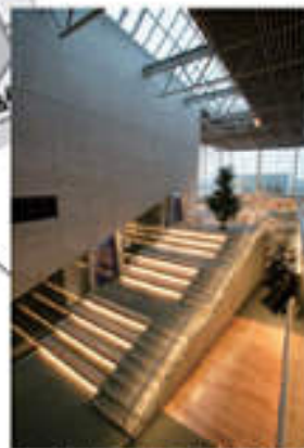
中ホールステップホワイエ ※催事の無い日は開放しています。