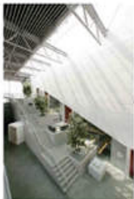
大ホールステップホワイエ ※催事の無い日は開放しています。