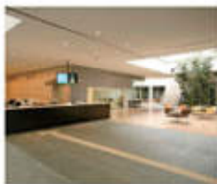
サービスセンター