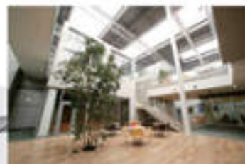
アクティブアラス