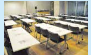
大アトリエ (1時間1,050円)