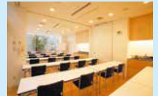
小アトリエ (1時間500円)