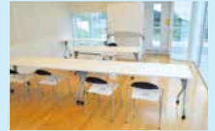
トレーニングルーム (1時間350円)