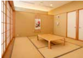
和室(しらゆり)(1時間250円)