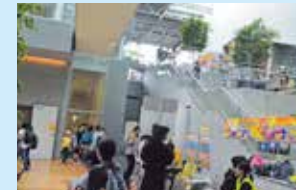
全館貸し切り (子どもの職業体験)