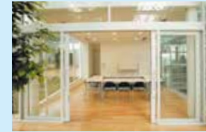
オープンルーム (1時間250円)

バリエーションに富んだ 21 の部屋があり、少人数の面接会から 60 名ほどの会議まで対応。