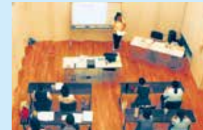
ミュージックルーム 1 (1時間1,000円)