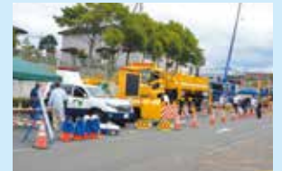
駐車場使用 (働く車の展示)