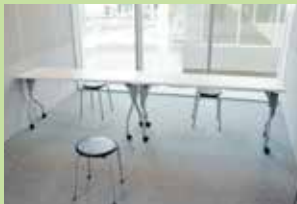
レッスンルーム 1 (1時間250円)