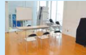
アンサンブルルーム 1 (1時間450円)