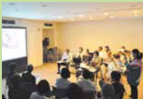
多目的室 1・2 (1時間600円)